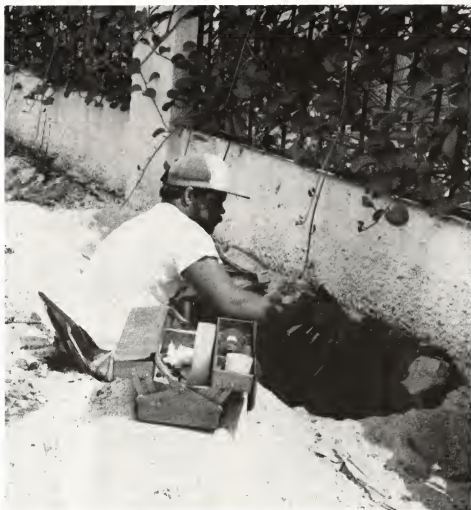
Den cuadro di realizacion di e proyecto grandi di telefon, na diferente parti kabelnan a ser tira pa trahadornan local asisti pa expertonan Hulandes.

Aruba ta conta awor cu un di e sistemanan di telefon mas moderno na mundo y e calidad di sonido ta perfecto. E reglanan tecnico ta cuadra cu e reglanan Internacional.